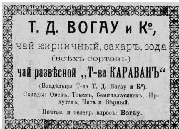
Реклама товарищества Торговый дом «Вогау и К°» в справочнике-указателе «Весь Омск» на 1911 г.

В 1901 году в Омске было около 800 торговых предприятий, в которых производилась торговля на 3 млн рублей. Количество торговых заведений к 1912 году увеличилось до 1038, сумма торговых оборотов – до 23,3 млн рублей в год.