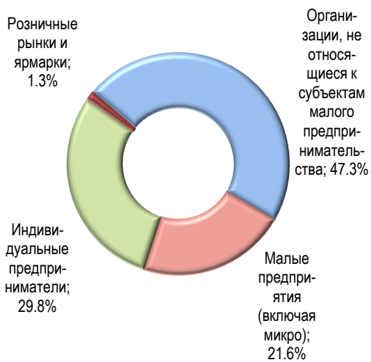
Доля торговых сетей в обороте розничной торговли Омской области в 2019 году (в процентах к итогу)