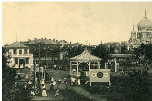
Детский сад на Соборной площади г. Омска. Почтовая открытка начала XX века.

Кроме стационарных садов открывались детские площадки (на 13 площадках г. Омска собиралось до четырехсот детей в возрасте от 4 до 13 лет). К концу 20-х годов в городе уже работали 8 детских садов (их называли детскими очагами) и 68 площадок, носивших, однако, сезонный характер. В результате лишь 2,5% детей в возрасте от 3-х до 8 лет посещали детские сады.