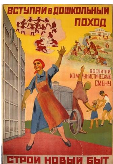
Агитационный плакат. 30-е гг.

Народный комиссариат просвещения СССР в 1929 году объявляет широкий «дошкольный поход», направленный на подъем дошкольного сектора, рост которого, по словам А.В. Луначарского, не находился «ни в каком соответствии ни с гораздо более быстрым ростом всех других форм образования, ни с важностью задачи».